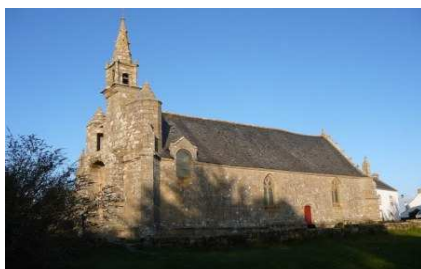
Chapelle ND des fleurs