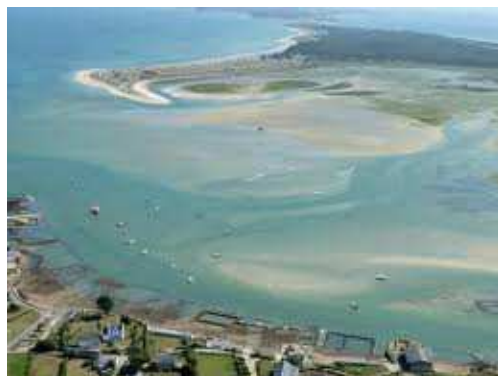
Les sables blancs