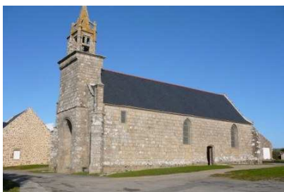
Chapelle Saint Barbe