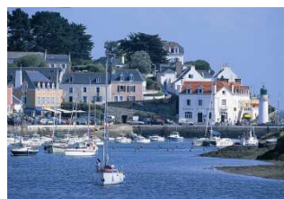
Port de Sauzon