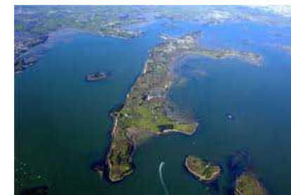
Ile aux Moines