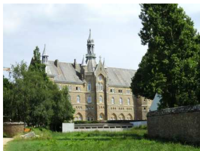
2 Abbayes de Kergonan (Ste Anne et St Michel)