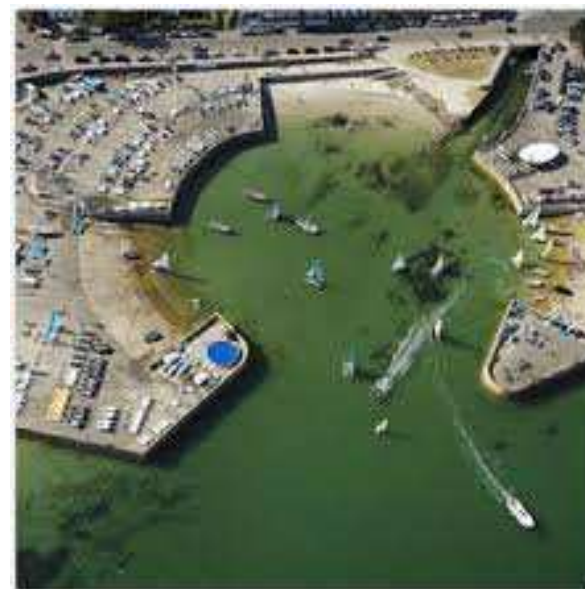
Yach Club de Carnac (tous les âges)